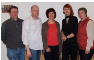
Ihr Team des IOS Regionalpartners Süd

Wir freuen uns darauf, Sie am 29.04.2010 in Groß Körös begrüßen zu dürfen.